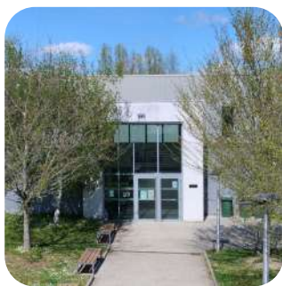
La Halles aux sports