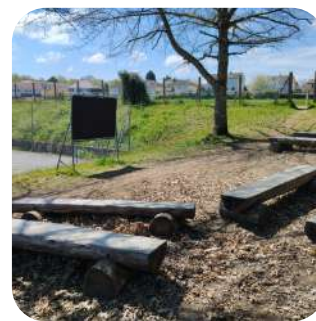
Classe plein air