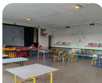
Salle d'accueil et activités pour les +6ans