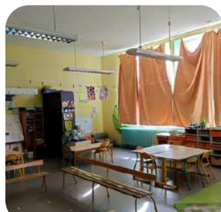
Salle d'activité 2 (classe MS-GS)