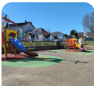
Cours de jeu pour les - 6 ans