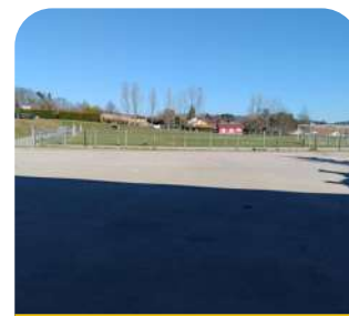
Cours de jeu pour l'accueil