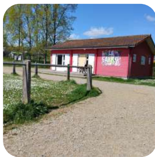
Chalet salle de BCD