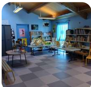
Salle d'activité 1